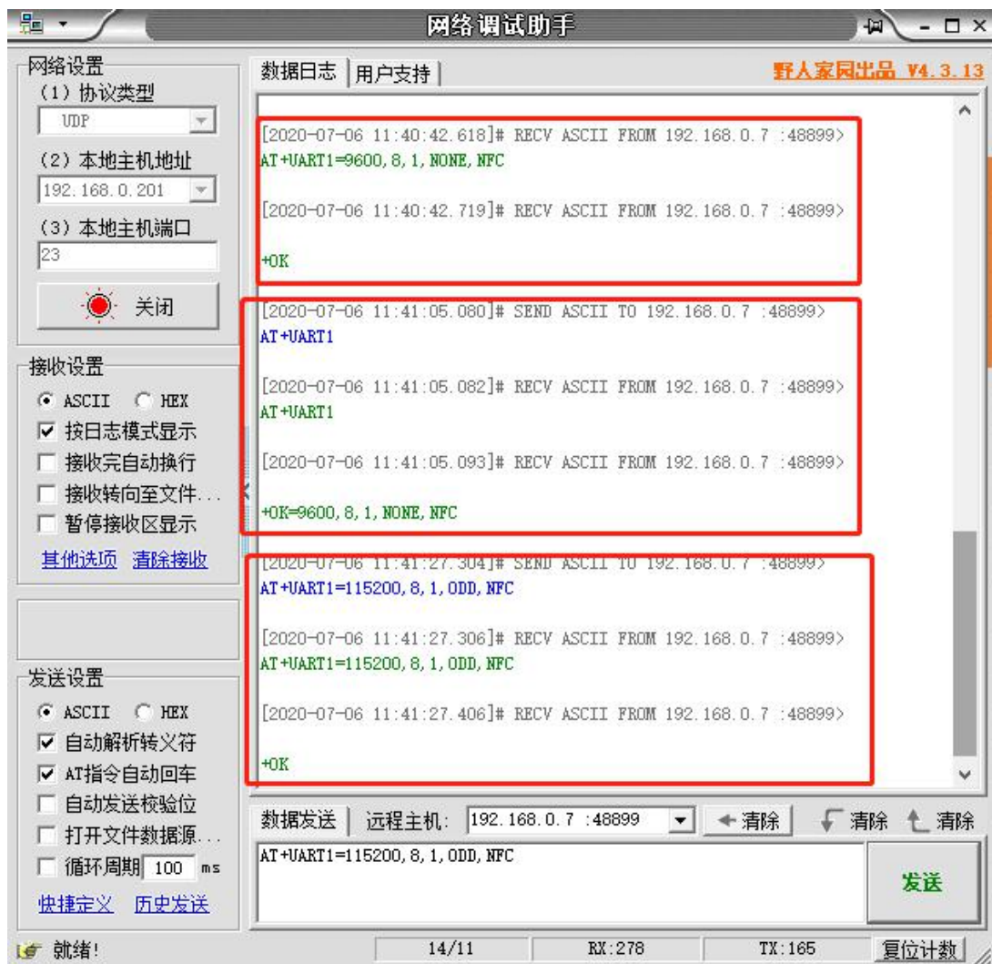
图 3 网络 AT 指令设置和查询