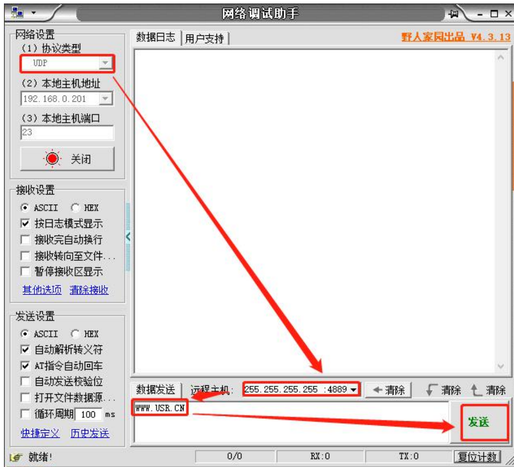
图 1 准备进入网络 AT 模式

通过网口 UDP 广播发送向端口 48899(远程主机设置为 255.255.255.255:48899)发送 WWW.USR.CN ，如果模块和电脑在同一网段内，则会收到模块回复的信息。