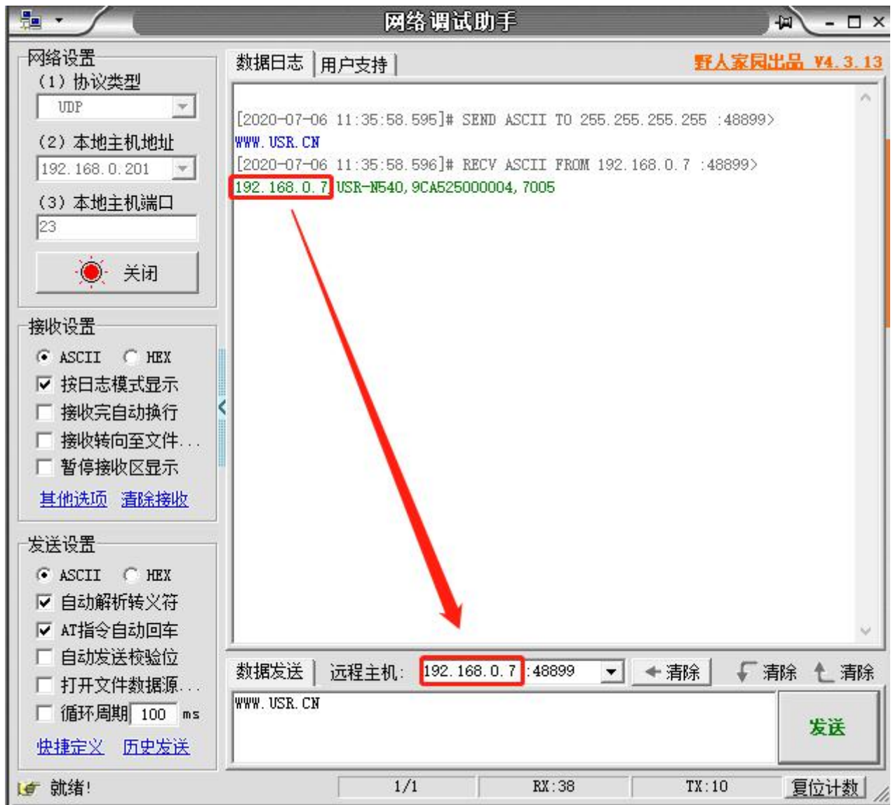
图 2 已进入网络 AT 模式

此时表明模块已经进入网络 AT 指令模式，如果挂载多个设备，使用广播会有多个设备同时回应，此时只需要修改远程主机 IP，与自己的设备 IP 保持一致。